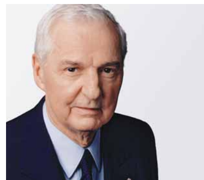
Paul Desmarais Vice-Président du Conseil d'Administration

Adresse professionnelle Groupe Bruxelles Lambert 24, avenue Marnix 1000 Bruxelles (Belgique)